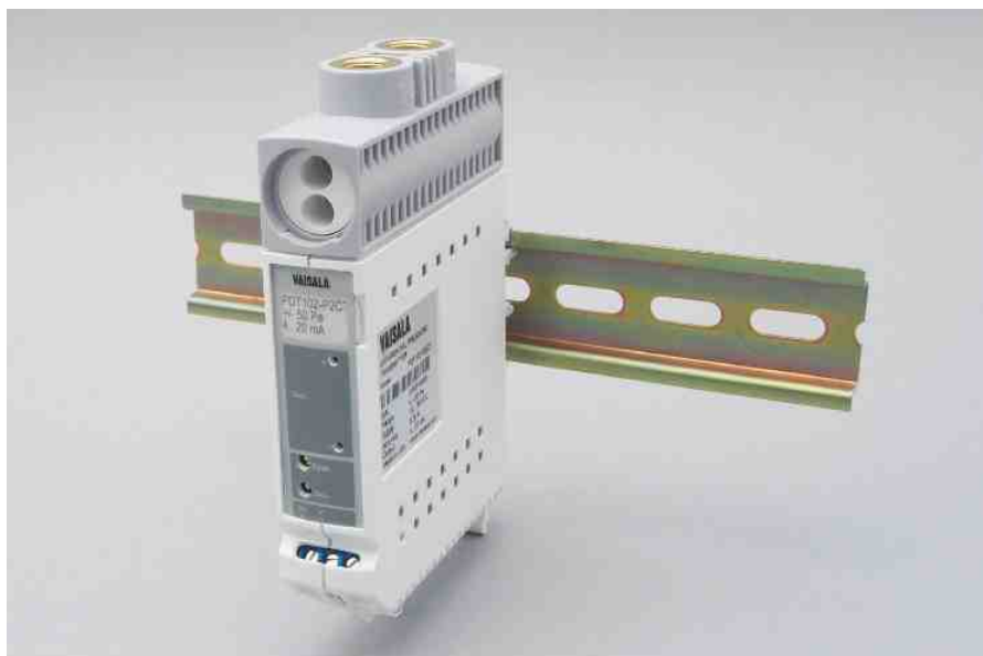
维萨拉微差压变送器PDT102配有过程阀门执行器和测试插座